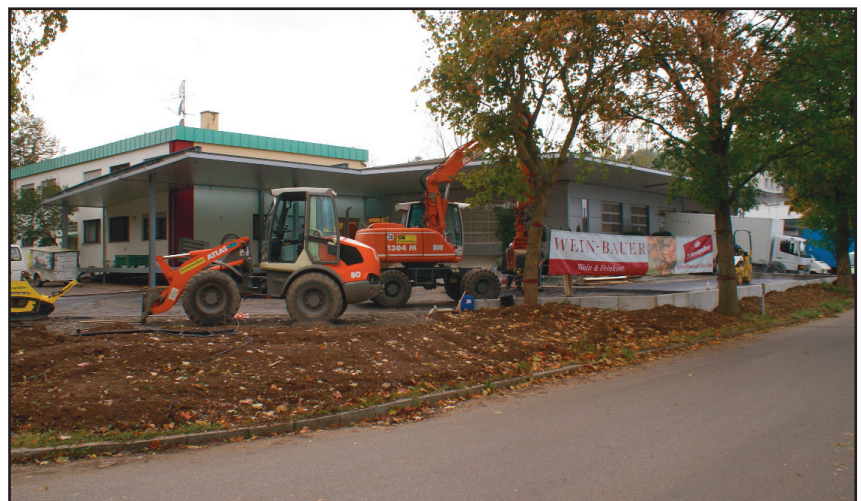
Wir schaffen das: Die Baustelle am 13.10.2009

In unserer Feinkostabteilung finden Sie den Verkostungsstand vom Forellenhof Rössle aus Honau, mit tollen Lachsforellen-Variationen.